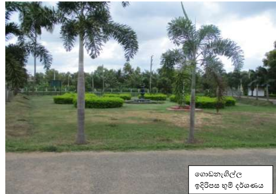
ගොඩනැගිල්ල ඉදිරිපස භූමි දර්ශණය