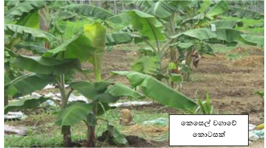
කෙසෙල් වගාවේ කොටසක්