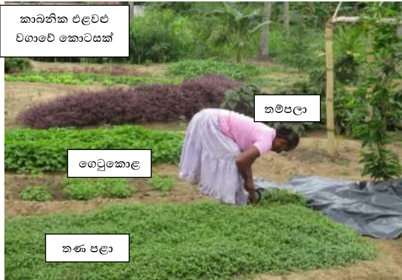
කාබනික එළවළු වගාවේ කොටසක්